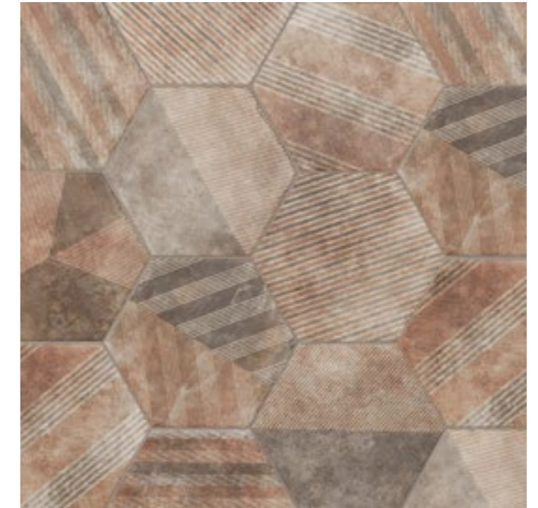
AMERICAN MISSION HEX. (MIX) 28,5 x 32,5 (G-59) 11,2" x 12,7" m 2