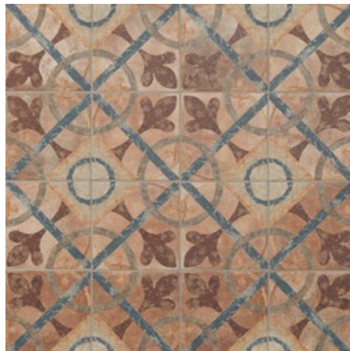
AMERICAN CLEVELAND 22,5 x 22,5 (G-57) 8,8" x 8,8" m 2