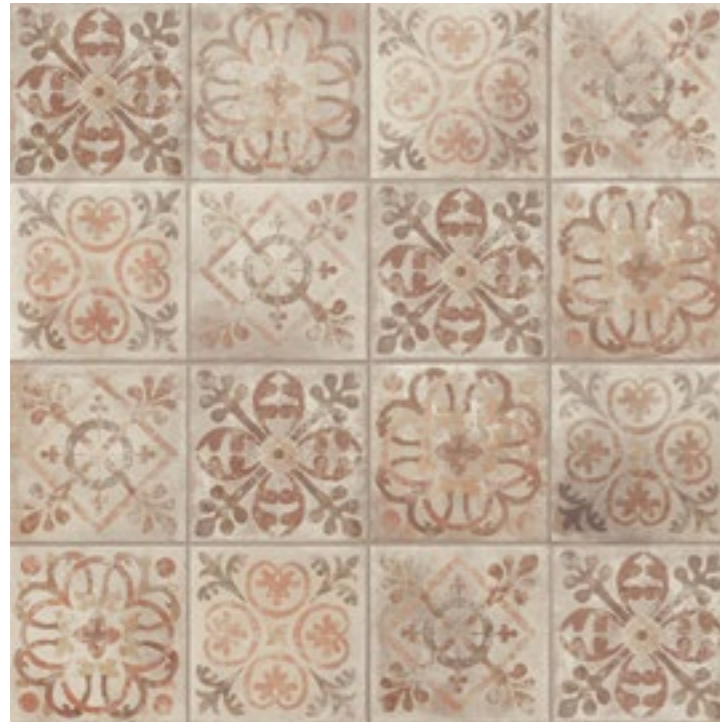
AMERICAN MELROSE (MIX) 22,5 x 22,5 (G-57) 8,8" x 8,8" m 2

* Para cada uso específico consultar nuestro Catálogo Técnico de Colocación - For specific applications, please see our technical installation catalogue