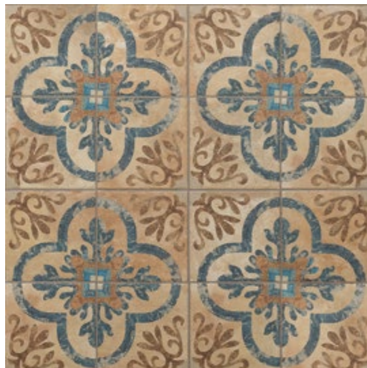
AMERICAN NEWTON 22,5 x 22,5 (G-57) 8,8" x 8,8" m 2