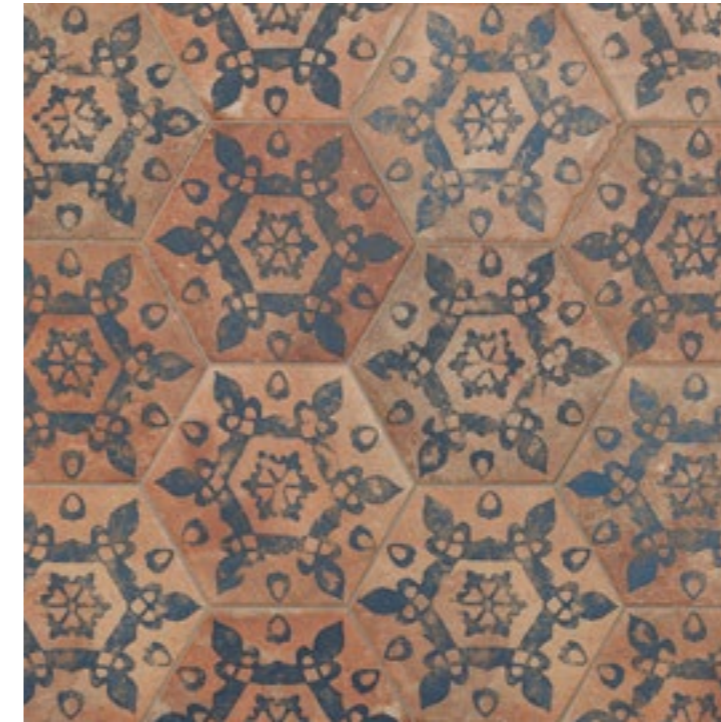
AMERICAN CHARLESTOWN HEX. 28,5 x 32,5 (G-59) 11,2" x 12,7" m 2