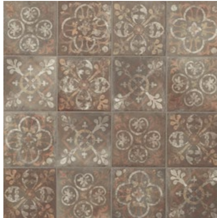
AMERICAN HARVARD (MIX) 22,5 x 22,5 (G-57) 8,8" x 8,8" m 2