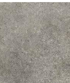
ROCKS DARK 36 x 36 (G 57) 14" x 14" m 2