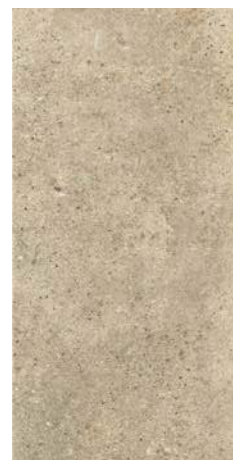
ROCKS BEIGE 30 x 60 (G 57) 11,8" x 23,6" m 2