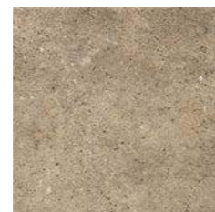
ROCKS BROWN 30 x 30 (G 25) 11,8" x 11,8" m 2