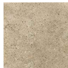
ROCKS BEIGE 30 x 30 (G 25) 11,8" x 11,8" m 2