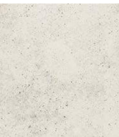
ROCKS WHITE 36 x 36 (G 57) 14" x 14" m 2