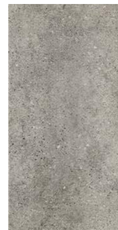
ROCKS DARK 30 x 60 (G 57) 11,8" x 23,6" m 2