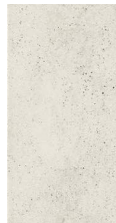
ROCKS WHITE 30 x 60 (G 57) 11,8" x 23,6" m 2