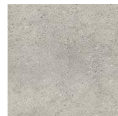
ROCKS GREY 30 x 30 (G 25) 11,8" x 11,8" m 2