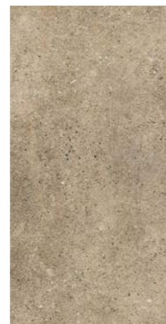
ROCKS BROWN 30 x 60 (G 57) 11,8" x 23,6" m 2