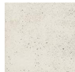
ROCKS WHITE 30 x 30 (G 25) 11,8" x 11,8" m 2