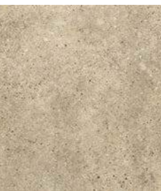
ROCKS BEIGE 36 x 36 (G 57) 14" x 14" m 2