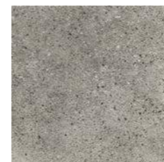
ROCKS DARK 30 x 30 (G 25) 11,8" x 11,8" m 2