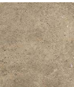
ROCKS BROWN 36 x 36 (G 57) 14" x 14" m 2