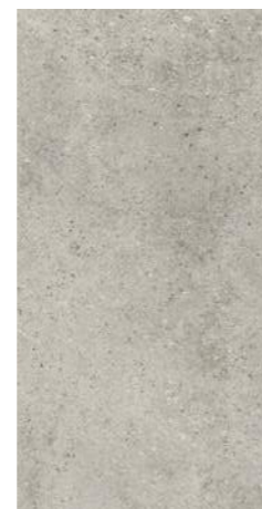
ROCKS GREY 30 x 60 (G 57) 11,8" x 23,6" m 2