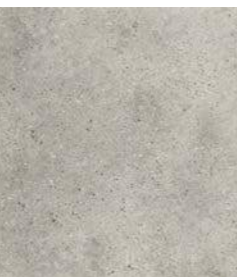
ROCKS GREY 36 x 36 (G 57) 14" x 14" m 2