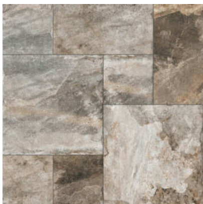
Ural Modular 50x50 Modular