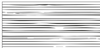
CRAFT 30x60 cm/11.8"x24" [PR] M458