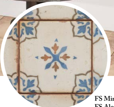
FS Mirambel-A FS Alora